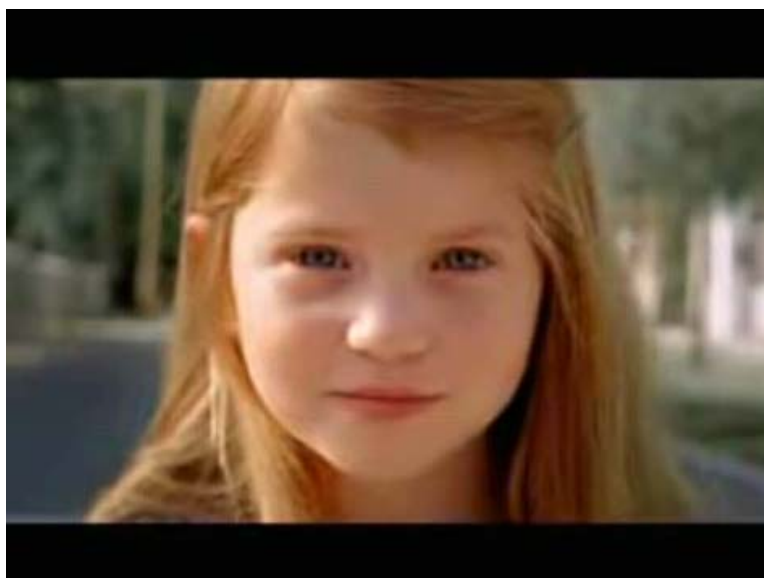
"OnSlaught" Vídeo original por la Campaña de Autoestima de Dove: http://www.youtube.com/watch?v=Et6JvKOW60I

La marca comercial Dove lanzó una serie de vídeos para fomentar la autoestima de la mujer haciendo una crítica del concepto de belleza que impone la publicidad. Sin embargo, Dove pertenece a la misma empresa que el desodorante Axe, por lo que generó una serie de remezclas de sus vídeos, tanto desde ámbitos amateurs como desde ONG´s, denunciando la doble moral de la propia Dove.