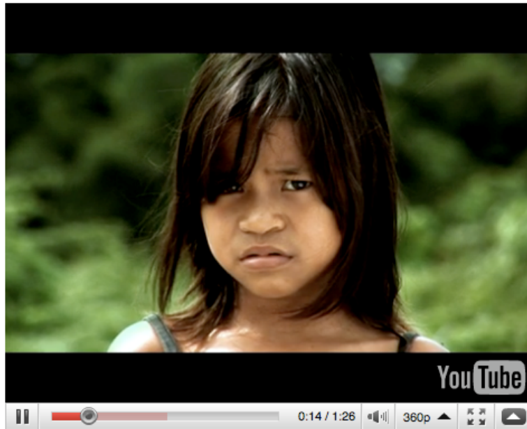
Vídeo de la Campaña Palm Oil de Greenpeace, que denuncia la deforestación en Asia a causa del gran uso de aceite de palma por parte de Dove http://www.youtube.com/watch?v=odI7pQFyjs0

Otros vídeos de la serie de remix: "A message for Unilever" Vídeo que parodia a Dove utilizando imágenes del producto de la misma compañía, el desodorante Axe (autoría amateur) http://www.youtube.com/watch?v=SwDEF-w4rJk