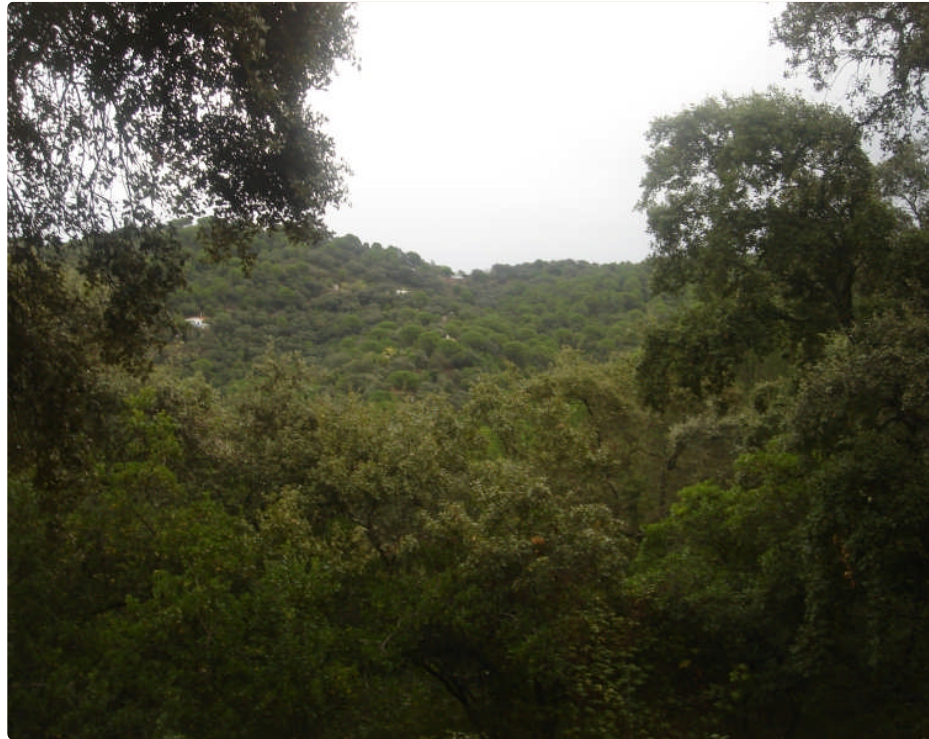
Encina Woods: le bois